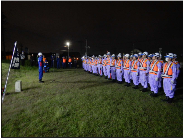
訓練開始前の副所長挨拶