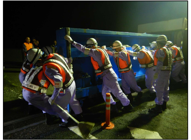
旦ノ島陸閘の操作訓練