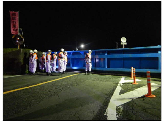
旦ノ島陸閘の閉鎖状況