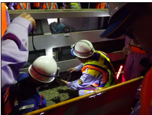
尻毛第一陸閘の点検状況